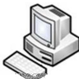
Usuário 05 AutoCAD Electrical