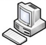
Usuário 01 Autodesk Inventor